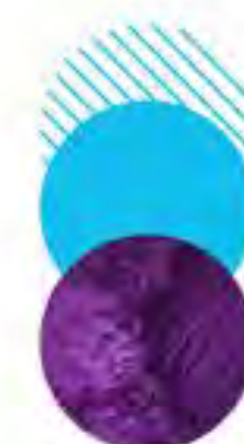
Centro de Crise - VS