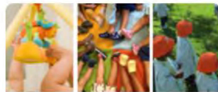
Creche Humanus CAM